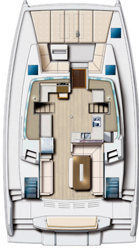
COCKPIT AND SALOON