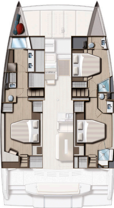
3 DOUBLE CABINS 3 HEADS VERSION