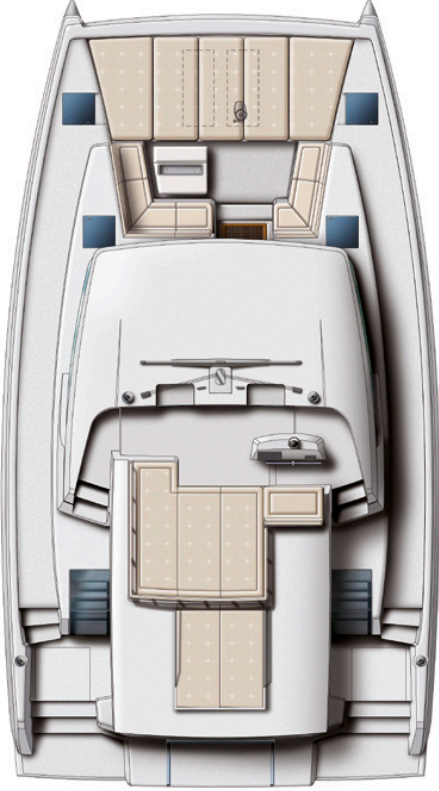
DECK AND FLYBRIDGE