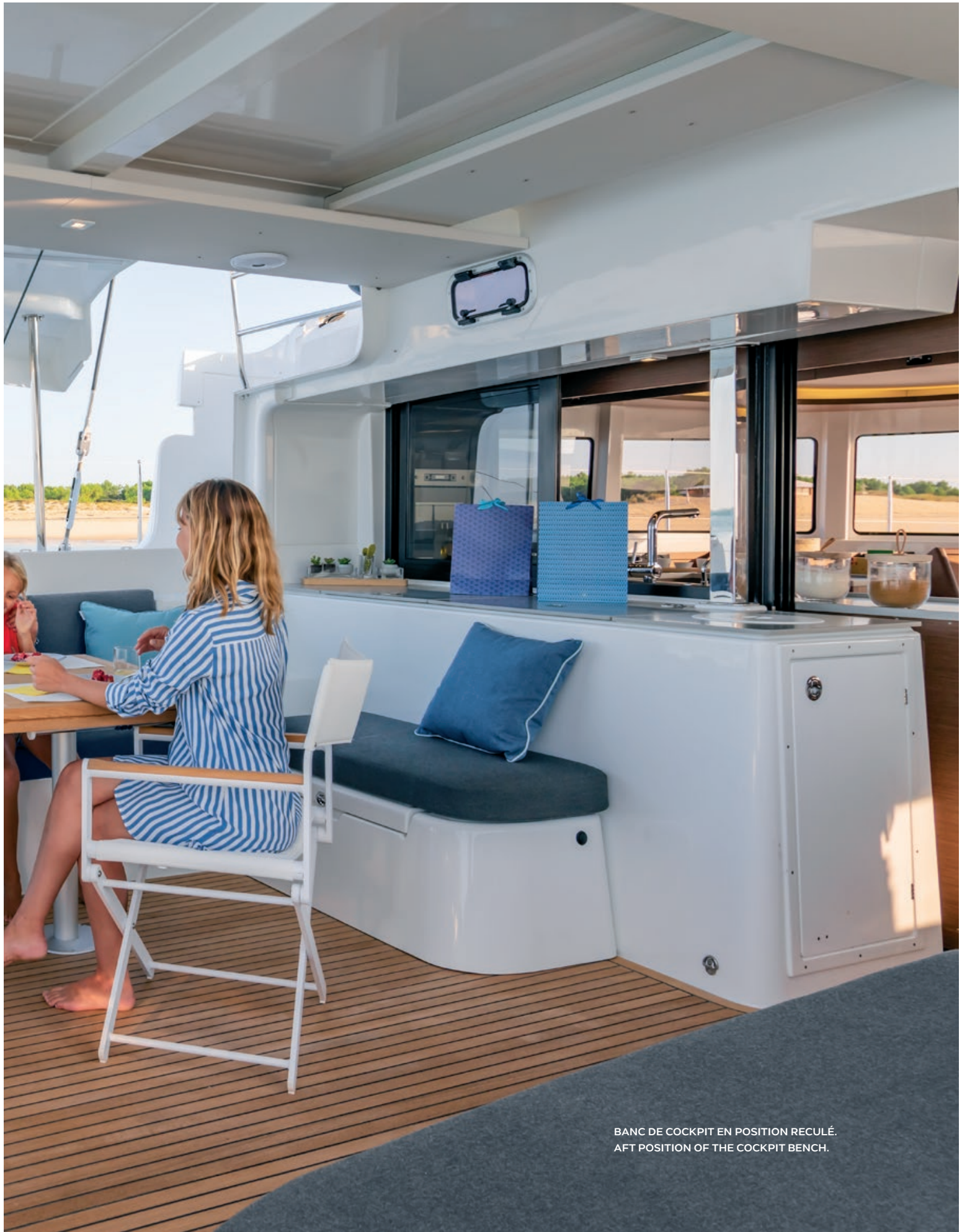
BANC DE COCKPIT EN POSITION RECLÉ. AFT POSITION OF THE COCKPIT BENCH.