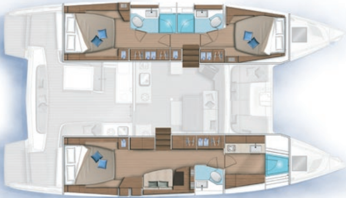
3 cabines, 3 salles d'eau / 3 cabins, 3 bathrooms