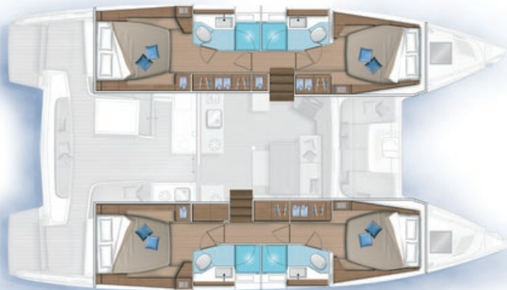
4 cabines, 4 salles d'eau / 4 cabins, 4 bathrooms