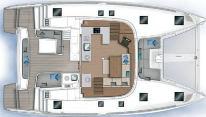
Carré et cockpit / Saloon and cockpit