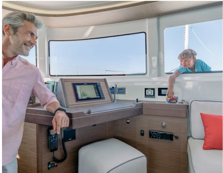
VITRAGE COULISSANT OUVERT. SLIDING SASH WINDOW OPENED.